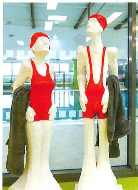
Im Foyer werden die Schwimmer erwartet

Vom Kassenbereich gelangen die Badegäste zu den Föhnplätzen und über den Stiefelgang zu den an der Ostseite des Schwimmbades gelegenen Umkleiden. Diese umfassen 14 Einzelumkleiden, eine Familien-, eine behindertengerechte Umkleide sowie vier Gruppenumkleiden, die für den Schulschwimmunterricht sowie für die Vereine vorgesehen sind. In 219 gelb-grünen Garderobenschränken, wovon drei barrierefrei erreichbar sind, können Kleidung und Wertgegenstände verstaut werden. Über den Barfußgang gelangt man im weiteren Verlauf in den Sanitärbereich mit je zwei Duschräumen pro Geschlecht und einer barrierefreien Dusche.