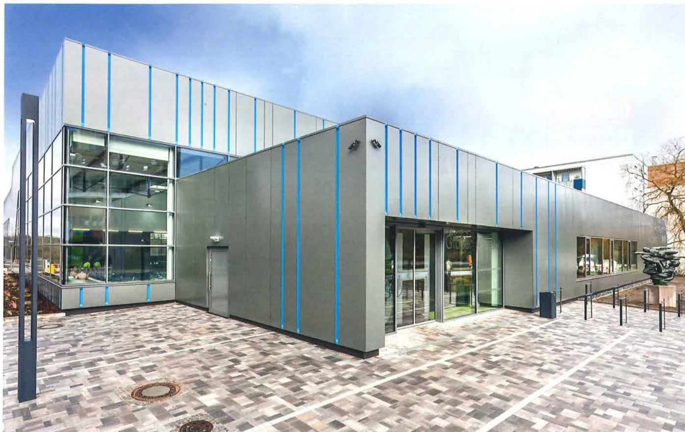
Neu in Schwerin: Die Schwimmhalle „Großer Dreesch“ ( www.schwerin.de )