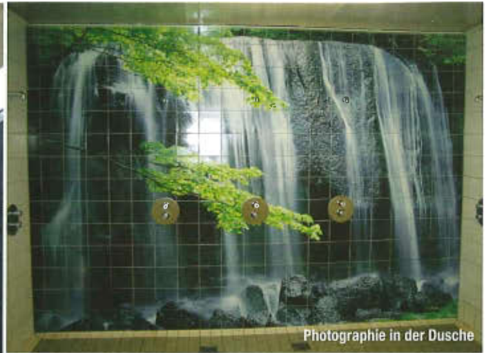
Photographie in der Dusche