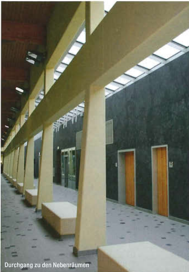
Durchgang zu den Nebenräumen