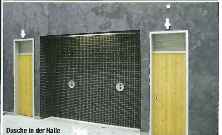
Dusche in der Halle