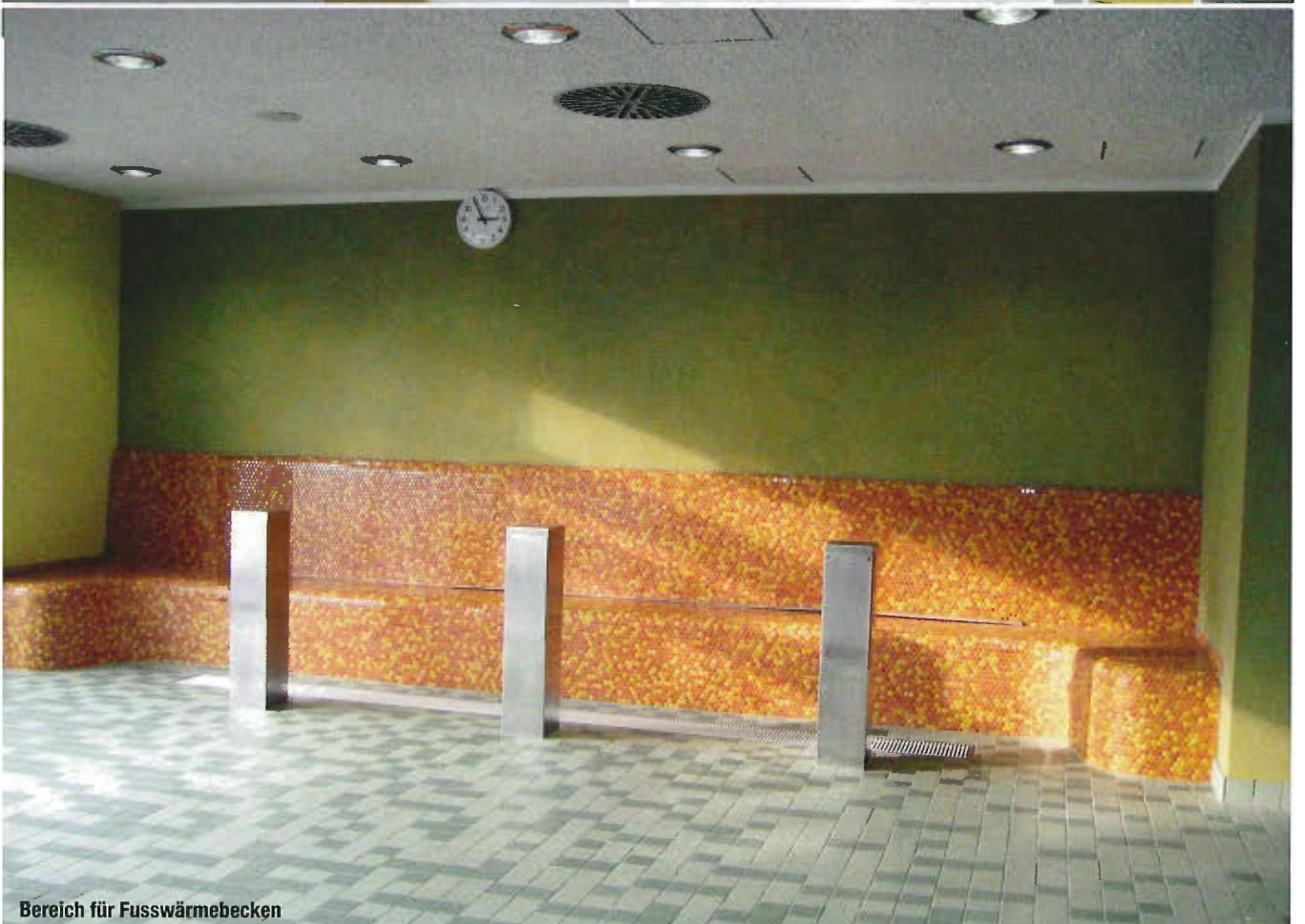
Bereich für Fusswärmebecken