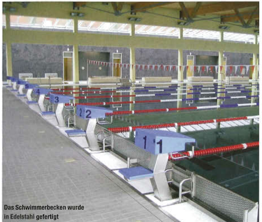
Das Schwimmerbecken wurde in Edelstahl gefertigt

len, der in die Eingangshalle mit Kassen, WC's und einer Wartezone führt. Von dort führt der Weg durch ein Drehkreuz über den Stiefelgang zu den Umkleidekabinen und anschließend über den Barfußgang zu den Duschräumen und der Halle. Die Büroräume können vom Stiefelgang betreten werden, verfügen darüber hinaus aber auch über einen eigenen Zugang von außen. Der gesamte Komplex ist barrierefrei gestaltet: Das Bad ist beispielsweise über einen Aufzug zu erreichen, innerhalb der Badeebene gibt es keinerlei Höhendifferenzen. Die Sanitär- und Umkleidebereiche der Behinderten liegen außerdem günstig an der Eingangshalle