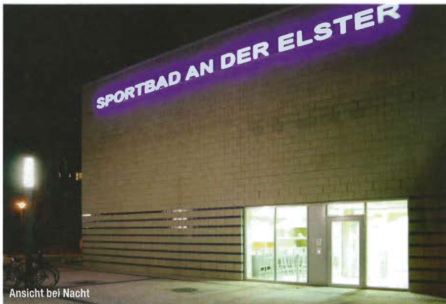
Ansicht bei Nacht