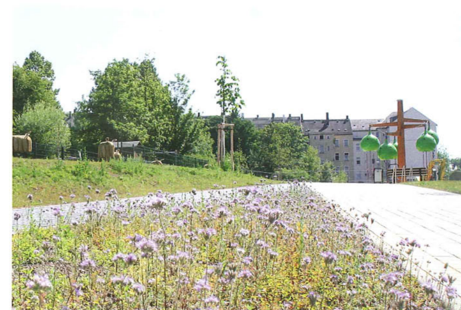
Über den Park verteilt finden Kinder und Jugendliche in den Bunten Gärten in Chemnitz viele Attraktionen.