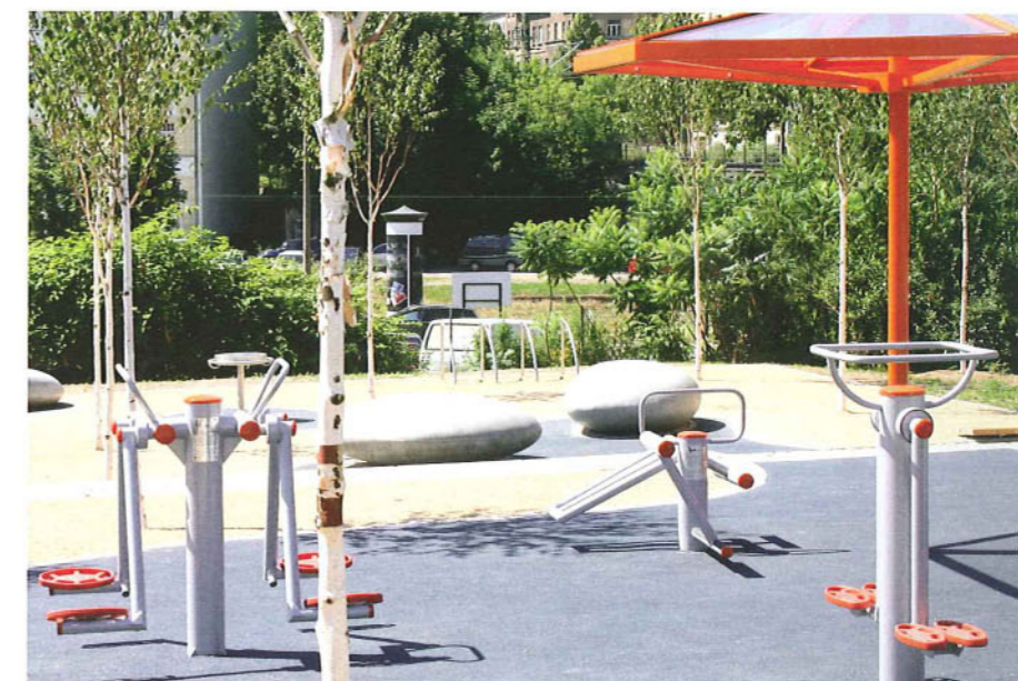
Der Teil des Parks mit Fitnessgeräten und Pavillons wird viel von Jugendlichen genutzt.