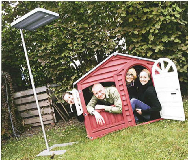
„Die Lichtstimmung erinnert an einen Sommertag“, loben Vitamin Office Architekten.

„Die Stehleuchte von Ataro überzeugt in erster Linie durch ihr schlichtes, edles und smartes Auftreten. Die fein nuancierte Farbigkeit des Standrohrs, wir nennen es ein stilvolles Champagner, unterstreicht noch die Eleganz der Form und gliedert die Lampe feinfühlicher, als es ein schlichtes Grau vermag, in seine Umgebung ein. Die schlichte Formensprache lässt die Stehleuchte in jeder Raumgestaltung in einem stimmigen Licht erscheinen. Seine Funktionalität ist dabei unbestreitbar.“