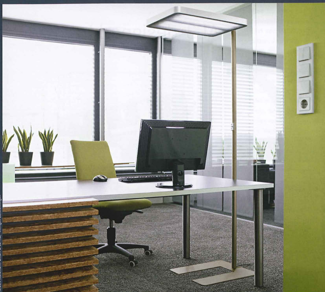
Hebert Waldmann GmbH & Co. KG, Villingen-Schwenningen

Die Stehleuchte Ataro verbindet zeitloses Design mit intelligenter Lichttechnik und minimiert den Energieverbrauch um bis zu 30 Prozent.