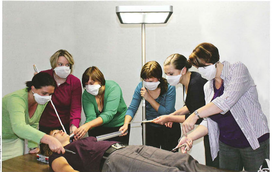
Kurzerhand funktioniert Vedacon den Schreibtisch zum Operationstisch um und demonstriert damit die vielseitigen Einsatzmöglichkeiten von Ataro.

„Der elegant designte Leuchtenkopf mit seinen abgerundeten Ecken besticht durch seine fließenden Kanten (...) Mit einer Aufbauhöhe, die gegen null geht, verwächst der Standfuß fast mit dem Fußboden, das Standrohr scheint direkt aus dem Boden zu kommen, der Stehfuß ist „weg-designed“. Seine Abmessungen wirken fast wie der Schattenwurf des Leuchtenkopfes. Pseudopraktische Details wie Rollen oder Räder zum Verstellen der Stehleuchte sind wohlthuend weggelassen worden. Die pfiffige Aussparung des Leuchtenfußes erlaubt dagegen enges Heranrücken an den Arbeitstisch und im Zusammenspiel mit dem beidseitigen 45-Grad-Schwenk des Leuchtenkopfes eine stets optimale Ausrichtung auf den Arbeitsplatz. Trendiges Weiß in Kombination mit gebogenem Aluminium verschafft Ataro einen äußerst eleganten Auftritt. Betrachtet man ausschließlich den Lichtaustritt nach unten, muss man sich zunächst vergewissern, ob die Leuchte überhaupt eingeschaltet ist, so perfekt blendungsfrei arbeitet die leicht getönte Prismenscheibe. In der Tat höchste Ingenieurskunst von den selbsternannten „Ingenieuren des Lichts“.