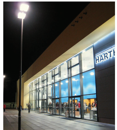
Blickfang: Die große Stahl-Glas-Fassade ist transparenter Übergang vom Stadtraum ins Foyer der Halle.